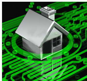
SISTEMAS DE SEGURIDAD ELECTRÓNICA